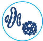
Reduktion von Bakterien