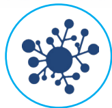
Reduktion von Schimmelpilzen