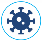
Reduktion von Viren